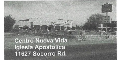
Centro Nueva Vida Iglesia Apostolica 11627 Socorro Rd.